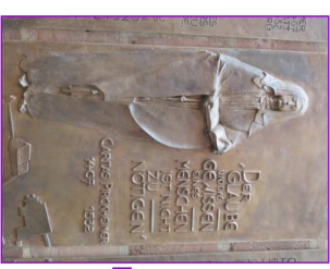
(1) Beginn um 12.30 Uhr mit Brezen + Kaffee/ Tee Cartas-Pirckheimer-Haus Königsr. 64 Historischer Impuls

Regina Ries-Prell, Theologin, Bayerischer Landesverband des KDFB: spirituelle Impulse