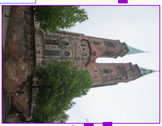
(4) Spaziergang zur Sebalduskirche Kirchenführung mit Schwerpunkt auf den Frauen